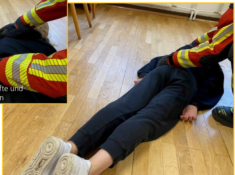
Patient vom Bauch auf den Rücken drehen