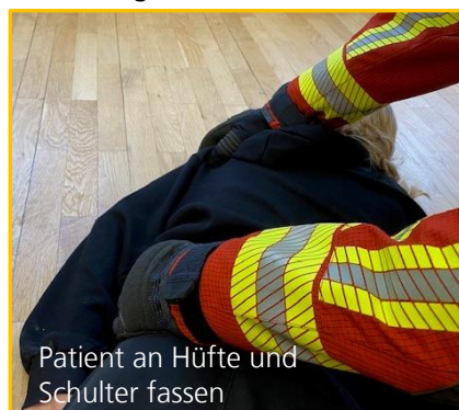
Patient an Hüfte und Schulter fassen