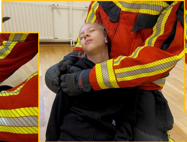
Neben Patienten knien und aufrichten