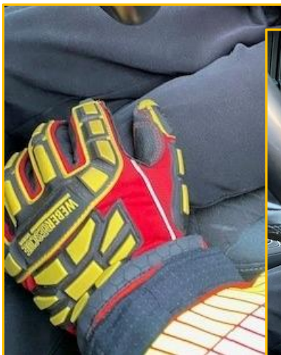
Knie des Patienten fassen