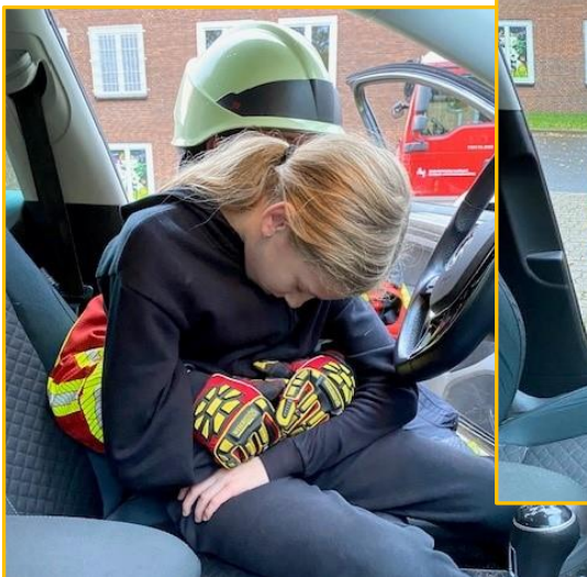
Patienten retten mittels Rautek-Griffs