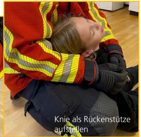
Knie als Rückenstütze aufstellen