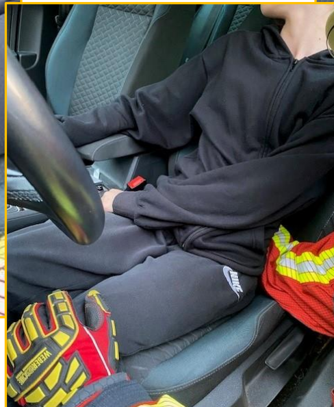
Neben Patienten knien und greifen