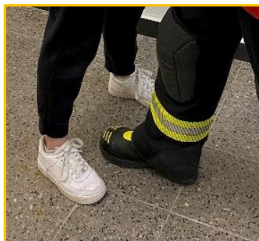
Fuß zwischen den Füßen